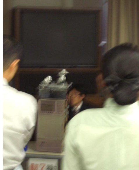
起震台による液クロ(模型)の耐震実験