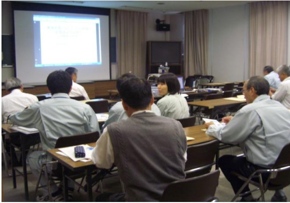
プロジェクターによる説明

平成21年10月26日 午後1時30分より午後3時まで 静岡県環境衛生科学研究所様 講堂にて 社内セミナー『試験室の耐震化』