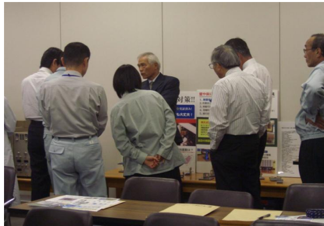
ガスクロの固定展示説明

セミナー前半は、講堂にて、口演、液クロ(模型)による多雨新実証試験及び各種固定例説明